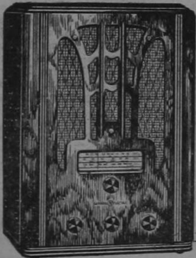
RADIO G. E. MODELO E-81

Es el sello distintivo de los nuevos radios General Electric de Focused Tone