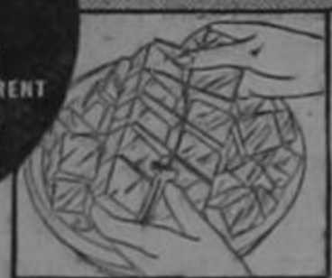
Plenty of ice cubes with Electrolux

RUNS ON KEROSENE (COAL OIL) WITHOUT MACHINERY NEEDS NO ELECTRIC CURRENT NO DAILY ATTENTION