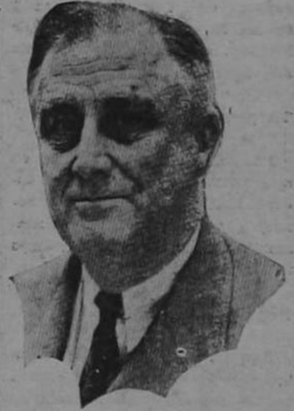
Franklyn D. Roosevelt

250.000 PERSONAS LE TRIBUTARON UNA RECEPCION SIN PRECEDENTE AL PRESIDENTE ROOSEVELT, AL REGRESAR ESTE A WASHINGTON ESTA MAÑANA