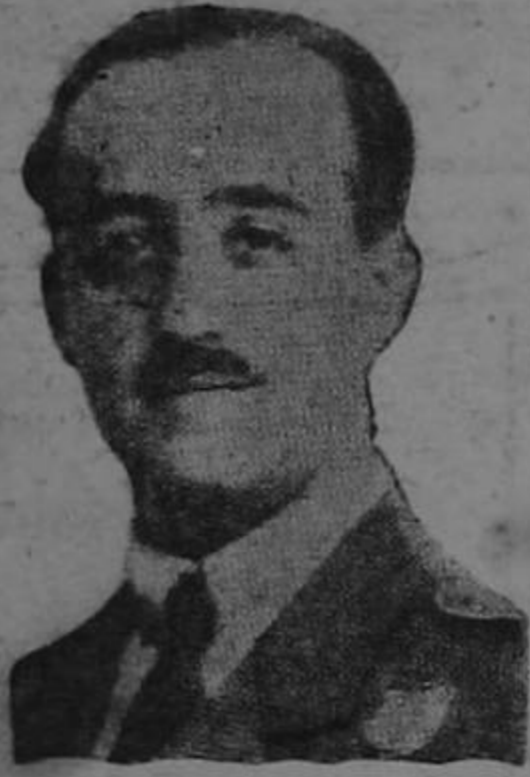
Gen. Francisco Franco

"Haga saber ante todo a sus lectores—le dijo—, que yo no tengo ninguna ambición personal, y que esta revolución no tiene por objeto transformar a un viejo militar en dictador. No soy hombre de Estado y no entiendo de política. Este es un movimiento nacional que trata de recoger las últimas energías españolas para salvar al país de la vergüenza y la anarquía... En primer lugar, se trata de restablecer el orden y el principio de autoridad desaparecidos, de volver su alma a España; se trata de abatir el comunismo y de suprimir radicalmente toda ingerencia "moscovita" en los asuntos de nuestro país... El Frente Popular se gloriaba de sus crímenes. La revuelta de Asturias estaba enseñando a las jóvenes generaciones como un ejemplo de civismo... Se cuenta actualmente en las Cortes González Peña, diputado de Oviedo que se robó 15 millones de pesetas en esa revuelta... No nos he-